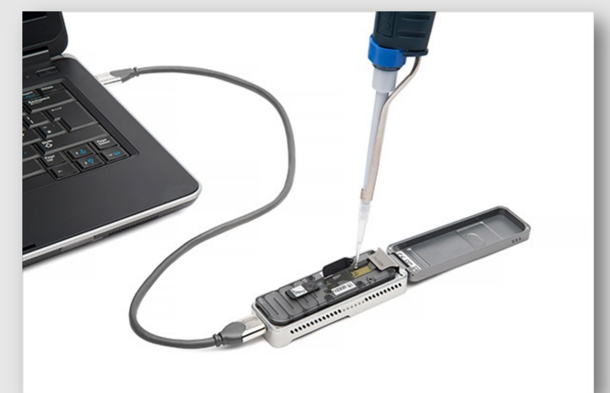
3rd Gen Sequenzierung (Oxford Nanopore) zur direkten Bestimmung von DNA Methylierung in der Markeridentifikation

Die oncgnostics GmbH hat sich auf die Entwicklung diagnostischer Tests auf Basis von epigenetischen Markern, sog. DNA-Methylierung, spezialisiert. Die ersten von oncgnostics in den Markt gebrachten CE IVD Tests GynTect® und ScreenYu Gyn® sind im Bereich Gebärmutterhalskrebs positioniert. Oncgnostics nutzt seine Expertise und technologischen Plattformen für die Entwicklung weiterer Tests, derzeit im Bereich Kopf-Hals-Tumoren.